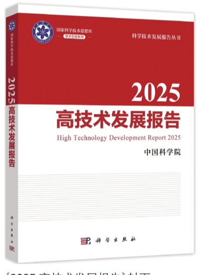
《2025 高技术发展报告》封面。

自1998年首次出版发行以来,《高技术发展报告》这份聚焦前沿科学原理、追踪全球技术趋势的年度报告已连续出版23本。20余年来,该报告系列已成为我国科技战略研究的重要品牌,深刻影响国家、地方及产业界的发展理念、政策制定和发展重点选择。