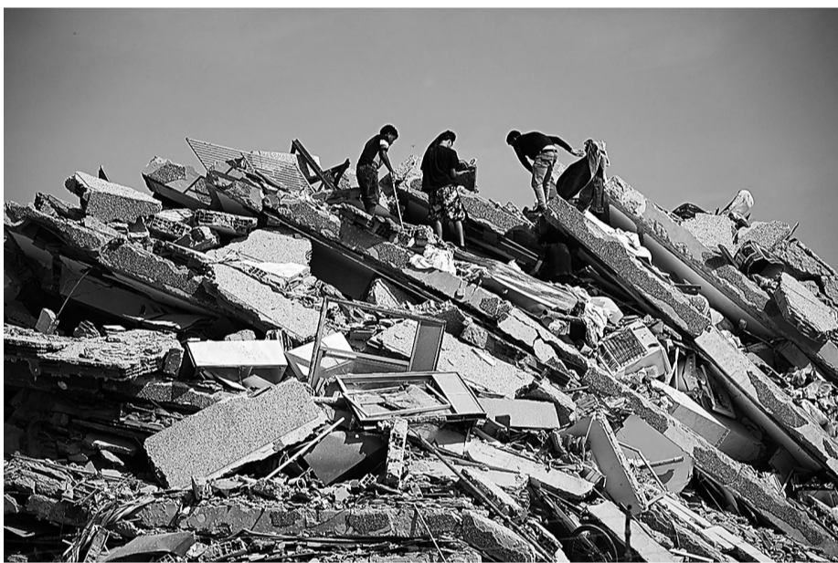
6月24日,委内瑞拉遭遇两场强震后,民众在卡蒂亚拉马尔一处坍塌建筑内搜寻幸存者。