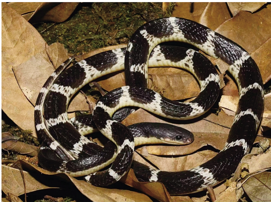
神经毒类剧毒毒素贞环蛇。

楼道、车底、田间地头……盛夏来临,社交平台上“蛇出没”的视频和帖子层出不穷,配上“蛇越来越多”的感叹,瞬间引发猜测——我们被蛇“包围”了吗?