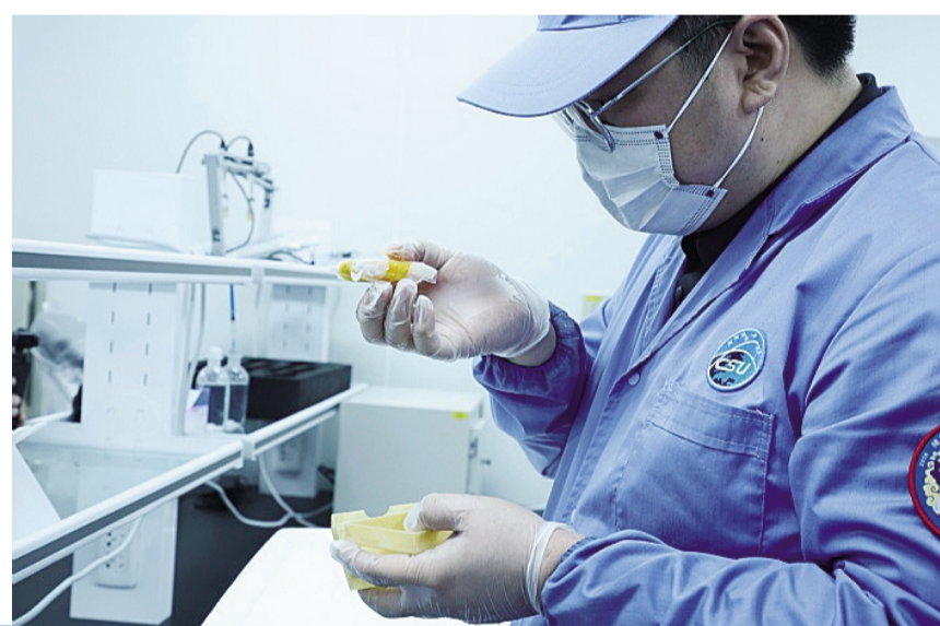
科学家在“拆包”。

今年全国科技工作者日系列活动以“奋进‘十五五’科技谱新篇”为主题,由中国科协会同中央宣传部、科技部联合举办。