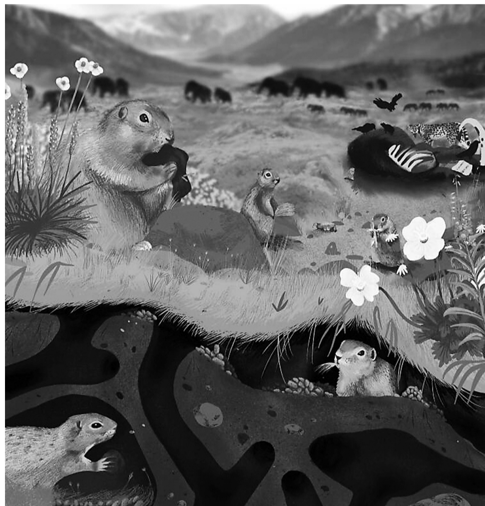
更新世育空地区的艺术复原图，展现了北极地松鼠在猛犸象草原生态系统中啃食肉类和采集植物的情景。

作者识别出了多种来自植物、微生物、昆虫和动物的DNA，包括猛犸象、马、美洲野牛和西伯利亚野牛等大型动物，以及200种不同的植物类群。作者得以从粪化石样本中重建了18个线粒体基因组，即12个地松鼠、一个野兔、两个野牛和3个马的基因组。从地松鼠样本中恢复的基因组，指向了北极地松鼠丰富的多样性，包括一个可追溯到约70万年