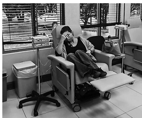
一名女性在接受化疗。

“无论如何，我们需要弄清楚如何阻止这种早期暴露。我们不希望一个两岁的孩子承受老年