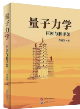
《量子力学：巨匠与脚手架》图书封面。