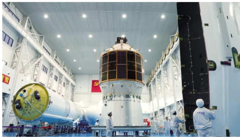
轻舟试验飞船(白象号)。

随后，与会嘉宾代表共同启动“促进水与卫生创新技术国际合作倡议”，并发布《促进水与卫生创新技术国际合作北京宣言》，明确以加强科研协同、推动技术创新与成果转化、深化国际合作为路径，共同推进实现人人享有安全饮水与卫生服务的目标。