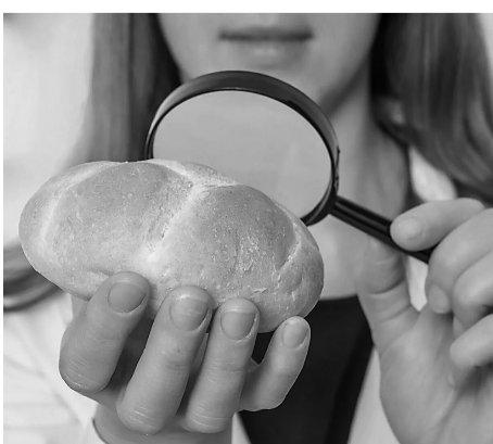
摄入碳水化合物可能会降低人体新陈代谢,并在不摄入额外热量的情况下增加体重。

相关论文信息: https://doi.org/10.1002/mnfr.70394