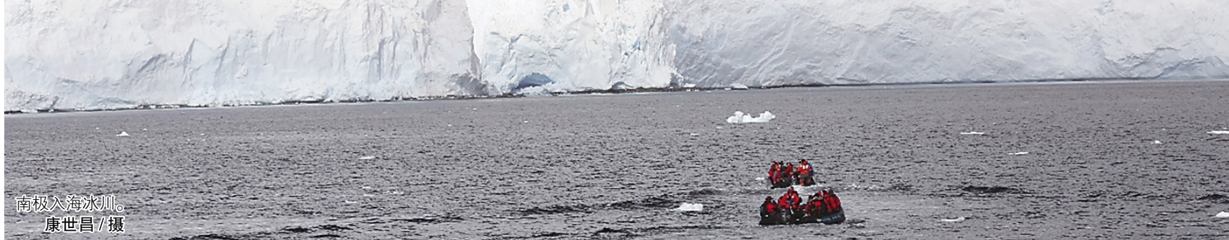
南极大海冰川。

相关论文信息: https://doi.org/10.1016/j.foodchem.2026.148549