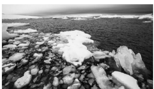
北冰洋海冰。