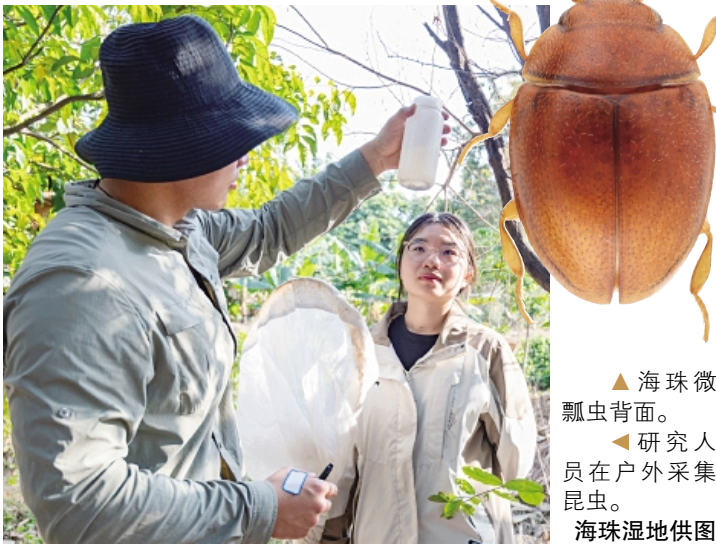
▲ 海珠微瓢虫背面。 ▲ 研究人员在户外采集昆虫。 ▲ 海珠湿地供图

相关论文信息： https://doi.org/10.11646/zootaxa.5528.1.5