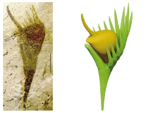
禹州隰果的全型标本及复原图。

此次发现的禹州隰果化石包括发现于 4 块化石上的 6 个标本，表明被子植物在二叠纪相当丰富。在二叠纪地层中大量发现的禹州隰果和