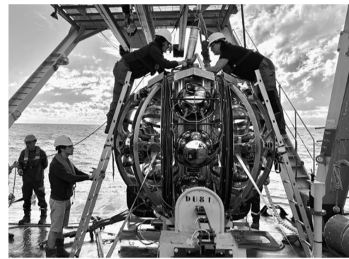
工程师准备将 1 个探测器添加到海底 KM3NeT 网络中。