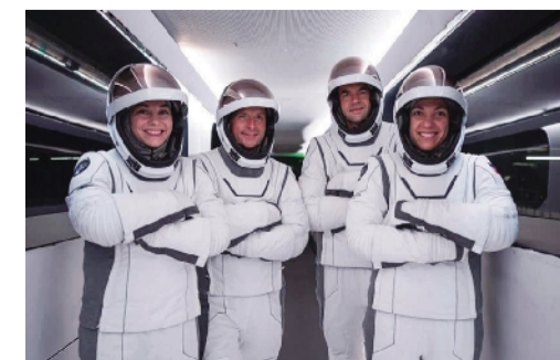
“北极星黎明号”任务的 4 名宇航员。

然而,尽管“北极星黎明号”任务存在诸多风险,但对“龙”飞船和 SpaceX 的新舱外活动服的极端准备应该会大大减轻这些危险。“探险家们”将在那里进行近 40 项科学实验。(李木子)