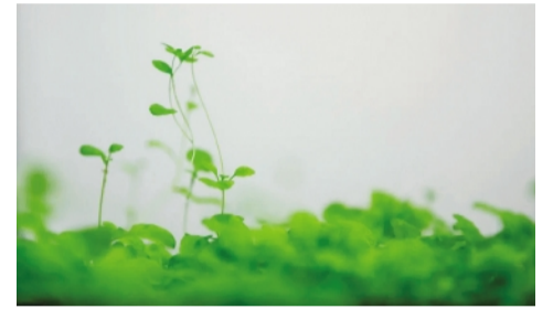
模式植物拟南芥。

为了确定“马达”的身份,研究团队首先在豌豆中构建了一个叶绿体蛋白转运实验系统,试图捕捉转运过程的中间状态。接着,他们利