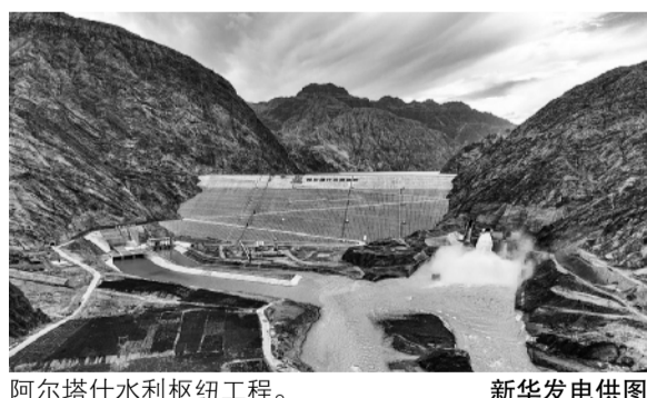
阿尔塔什水利枢纽工程。