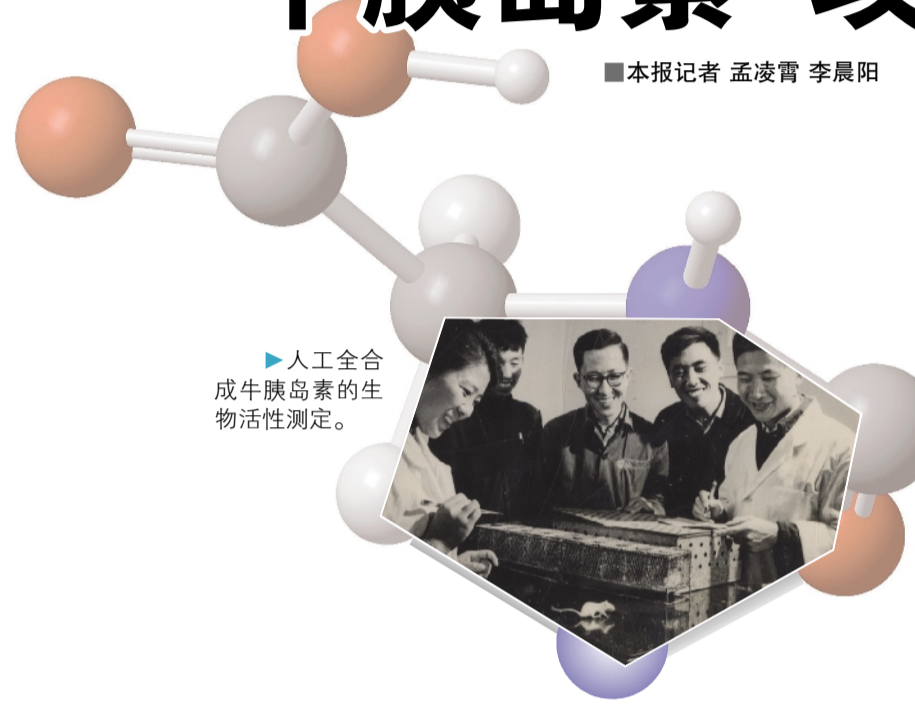
▶人工合成牛胰岛素的生物活性测定。