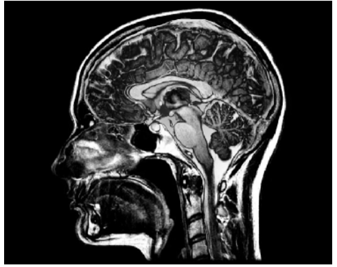
大脑的某些部分往往会与其他区域一起萎缩和变形。

然而，Davatzikos 警告说，这项研究“并不意味着一切都可以归结为 5 种模式”。他的团队正在寻找包括更广泛的神经系统疾病和更大种