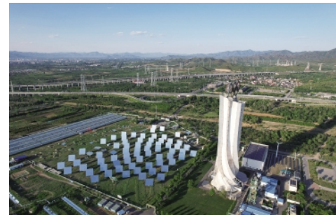
位于北京延庆的超临界二氧化碳太阳能发电实验基地。

在能量转换过程的相互作用机制方面,该项目构建了高太阳能流、高温、高膨胀比、高比功的高效太阳能发电系统主要参数本构匹