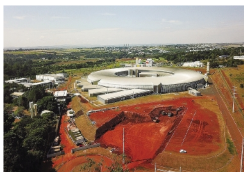
正在建设中的“猎户座”生物安全实验室。

值得一提的是,一旦 Orion 建造完成,它将成为世界上第一个配备同步加速器的 BSL-4 设施。它可以使用 CNPEM 园区内的同步加速器光源“天狼星”(Sirius)揭示病原体结构以及它们感染细胞、组织和小型生物的过程。(徐锐)