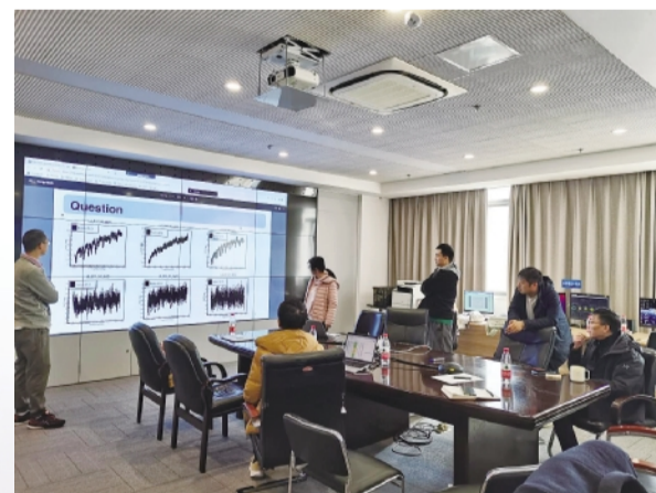
2023年12月9日,“悟空”号数据分析小组开会讨论。