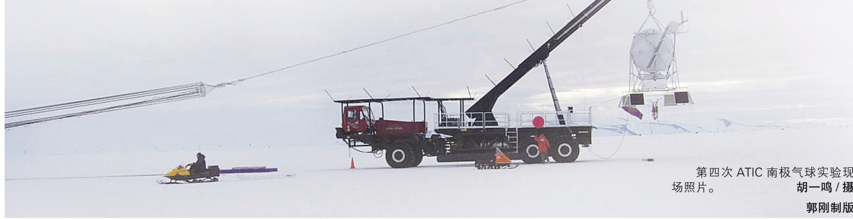
第四次ATIC南极气球实验现场照片。胡一鸣/摄 郭刚制版