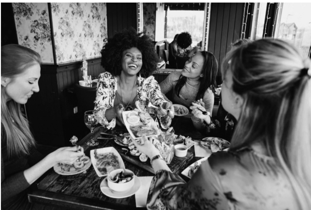
朋友一起分享的不仅是美食。