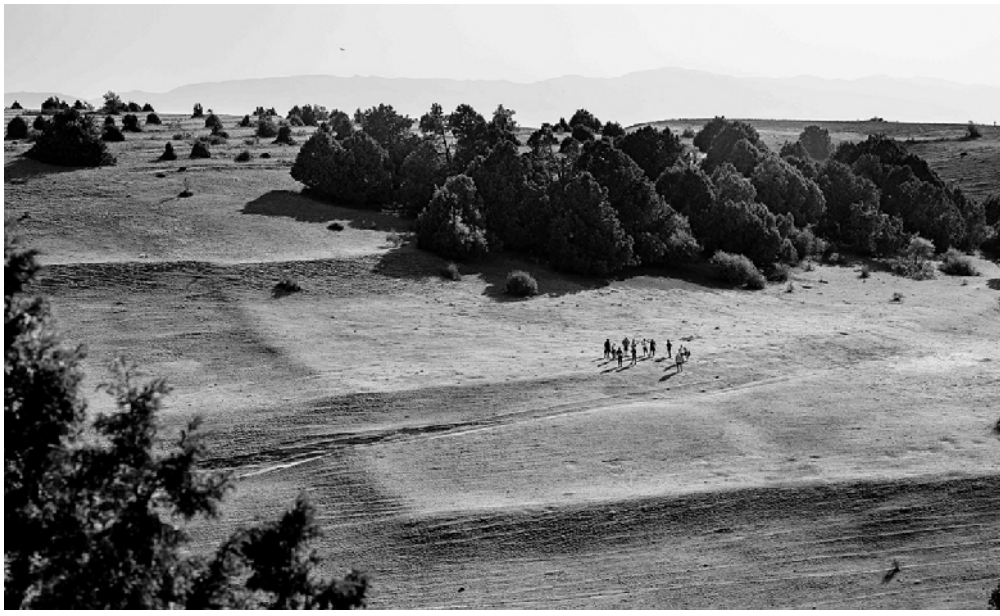
中世纪城市图贡布拉克的防御工事在地下下仍然可以看到。