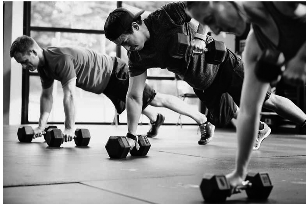
力量训练对健康很重要。

“在英国，人们每周进行 150 分钟的体育活动实际上具有偶然性。”Sandercock 说，“例如，