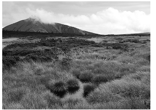
波兰一处沼泽的泥炭层记录了核试验后沉降的钚峰值。