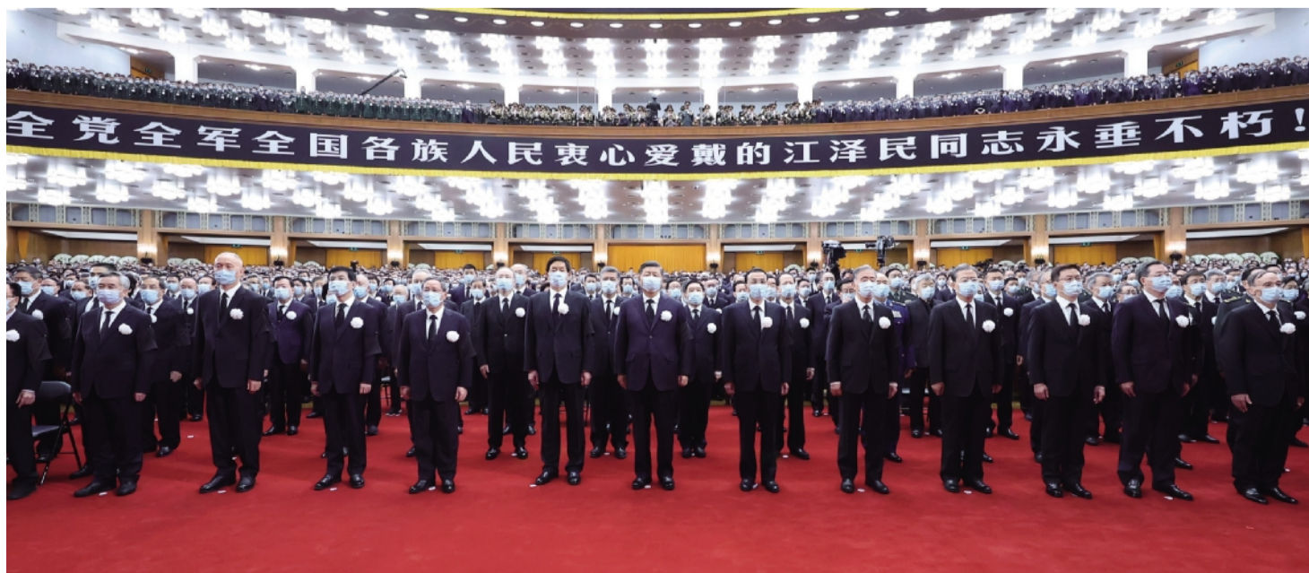
12 月 6 日,中共中央、全国人大常委会、国务院、全国政协、中央军委在北京人民大会堂隆重举行江泽民同志追悼大会。习近平、李克强、栗战书、汪洋、李强、赵乐际、王沪宁、韩正、蔡奇、丁薛祥、李希、王岐山等参加大会。