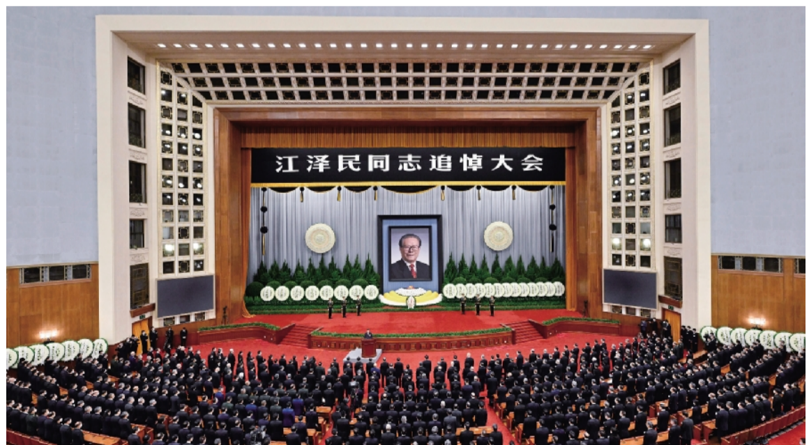
12 月 6 日,中共中央、全国人大常委会、国务院、全国政协、中央军委在北京人民大会堂隆重举行江泽民同志追悼大会。