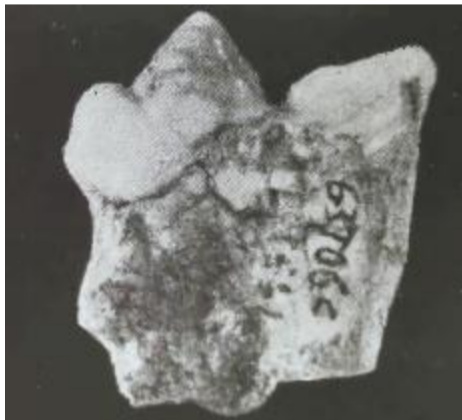
蓝田王岭发现的虎上裂齿化石

1924年，奥地利古生物学家师丹斯基根据这些标本建立了一个种，先是命名为“古中华虎”。后来，有中国学者认为它与虎有很多类似的形态特