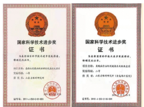
2011年、2015年,山东省眼科研究所两次获得国家科技进步奖二等奖。

“问渠哪得清如许,为有源头活水来。”山东省眼科研究所是山东大学、武汉大学、青岛大学、山东第一医科大学等国内知名高校眼科学