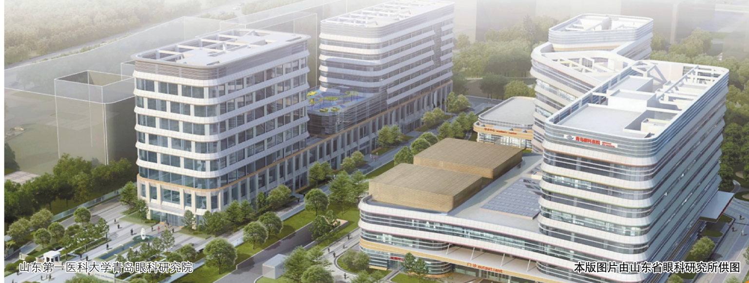
山东第一医科大学青岛眼科医院