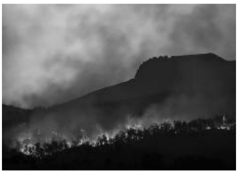
气候变化引发山火。

本报讯 一项建模研究指出，《蒙特利尔议定书》或能通过保护植物不受紫外线损伤来缓解气候变化，进而避免碳储量下降以及大气二氧化碳水平上升。相关论文8月18日刊登于《自然》。