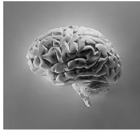
人类大脑中听觉和语言处理是并行的。

该研究表明，传统语音处理模型过于简化，甚至很可能是错误的。研究人员推测，颞上回可能独立于初级听觉皮层发挥作用，而不是初级听觉皮层处理的下一步。