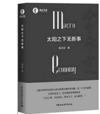
《太阳之下无新事》,余永定著,中国社会科学出版社2019年12月出版,定价:258元

有人大概会说:这不是进化论早就讲过的吗?的确,人类是从灵长类动物进化而来,这在人类可以算是最为深入人心的科学知识之一。但是,恰恰是因为进化,人类是不是就比其他灵长类动物“高猿一等”了呢?