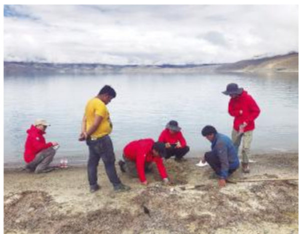
研究人员在取样