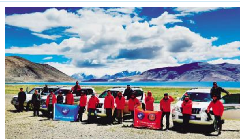
佩枯错湖考察队员