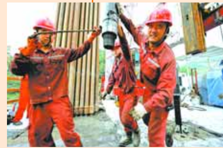
涪陵页岩气田,一场抗疫复产攻坚战同时打响。

然而,口罩库存只能解一时之需,扩能增产方显央企担当。2月5日,国资委召开紧急会议,号召央企快速增产口罩。“国家需要什么,我们就生产什么”,集团公司党组当机立断,跨界增产防护口罩。我们全球广寻源,抢抓熔喷布;发出“英雄帖”,寻找口罩机;派出突击队,昼夜大会战,12天实现日产量超百万,累计增产口罩2亿只。 熔喷布是生产口罩的核心原料。2月下旬,市场紧张局面加剧,熔喷布价格飞涨。中国石化落实中央要求,增产熔喷布生产线,稳定