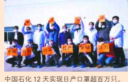
中国石化12天实现日产量超百万只。