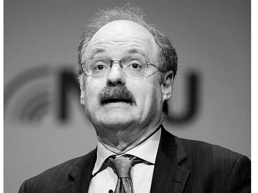
Mark Walport 掌舵英国研究与创新理事会, 这是监管每年 60 亿英镑研究经费的政府机构。