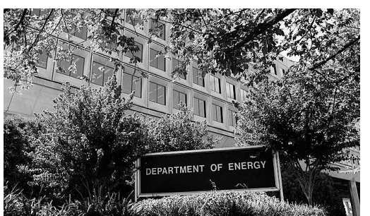
位于华盛顿特区的美国能源部总部。