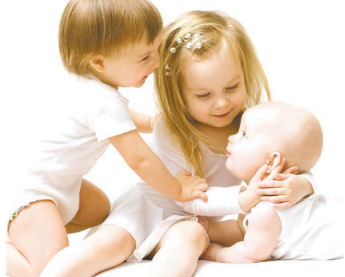
最受欢迎的女宝宝名字是艾玛(Emma),男宝宝名字则是诺亚(Noah)。

近日,美国社会保障局发布了2016年美国最受欢迎的宝宝名字排行榜,其中艾玛(Emma)连续三年成为最受欢迎的女宝宝名字,而男宝宝名字榜则由诺亚(Noah)连续第四年领跑。