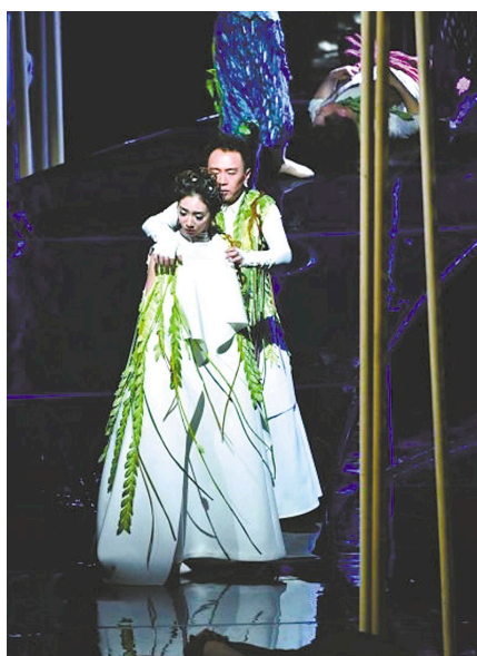
国家大剧院制作的《仲夏夜之梦》

狄卡特律斯是剧中唯一一位没有被解除爱情幻觉的人,他最后说:“我不知道是什么力量——但一定是有一种力量——使我对赫米娅的爱情像霜雪一样融解……我一切的忠信,一切的心思,一切乐意的眼光,都是属于海丽娜一个人了。”这种力量也许他永远都不会知道了。爱情和战争一样,过程并不重要,重要的是结果——谁和谁在一起白头偕老。莎士比亚和剧