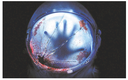
惊悚灾难电影《异星觉醒》

——对于上周末上映的好莱坞惊悚科幻片《异星觉醒》,有观影者自发给出如此“友情提醒”。据悉,片中不少血腥镜头,不仅让十来岁的孩子感到害怕,就连一些成年人也会掩面而过,甚至整场都能听到孩子被吓哭的声音。对于该片,绝大多数影院并没有给出任何观影提示,诸如标明“可能引起心理不适”字眼,或是提醒未成年人观看需要家长陪同。由于惊悚指数较高,该片在北美率先上映时就已评为R级,即属于限制级,13岁至17岁观众要求有父母或成人陪同观看。有专家建议,为适应《电影产业促进法》的步伐,不妨重新审视此前一些管理办法,理清头绪,尽可能维护各方权益。(周天整理)