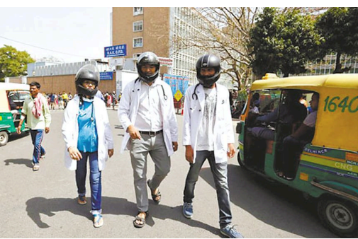
印度医务人员戴头盔上路,抗议针对医生的暴力行为。

有医生表示,产生医患暴力冲突的原因是多方面的,包括公共医疗系统太过拥挤,导致医生与病人及其家属之间的联系逐渐减弱等,腐败和过度收费也破坏了人们与医疗系统之间的关系。“印度有很大一部分人口被剥夺了享受医疗照顾的权利。”设在德里的乔治全球健康机构执行董事维卡南德·杰哈说,“对于大部分人来说,一