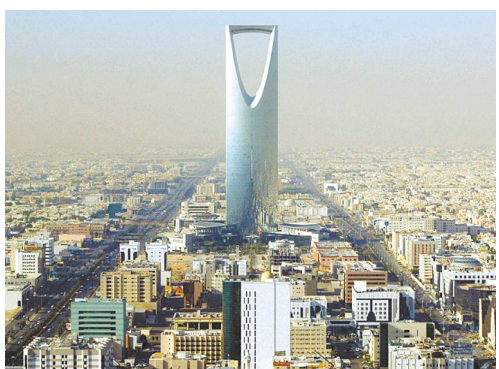
沙特阿拉伯的首批电影院有望在 2018 年 3 月开张。

该部表示,这项举措将开启一个超过 3200 万人的沙特国内电影市场,到 2030 年,预计将开办超过 300 家电影院,银幕数量达到 2000 块。