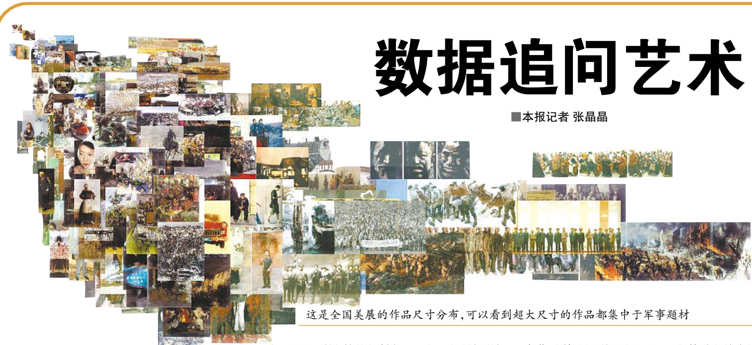
这是全国美展的作品尺寸分布,可以看到超大尺寸的作品都集中于军事题材