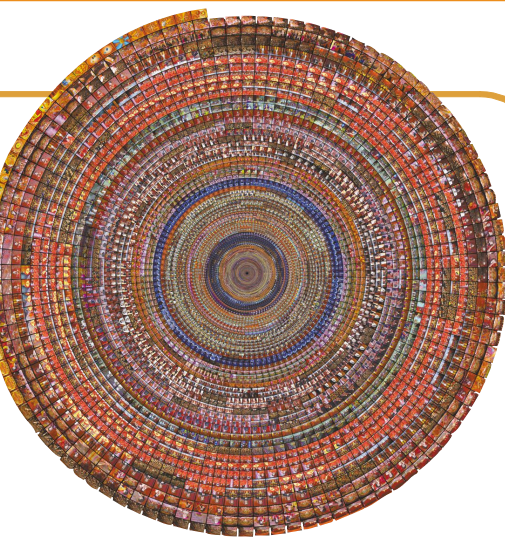
将 2004 年春晚每秒画面按时间线卷起来之后

除了对全国美展获奖作品进行研究之外,向帆还和伙伴们一道,对 1983 年至 2015 年 33 年的春节联欢晚会进行了分析。“每年春节晚会,大家都觉得是一样的。我就在想它是不是真的一