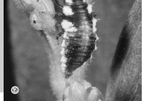
④蚜狮的成虫,草蛉。 ⑤没有伪装的蚜狮照样可以大快朵颐蚜虫。