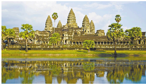
2015年柬埔寨接待的国际游客共有480万人次。图为吴哥窟。

活动现场的虚拟现实体验区总是人满为患。观众戴上头戴式虚拟现实设备,面向视频,就能恍惚以为自己在奔跑,在跟随主人公移动的过程中,甚至还能感受到她的呼吸。现场有些参与体验的观众在视频进行一半时就退出了,称“因为