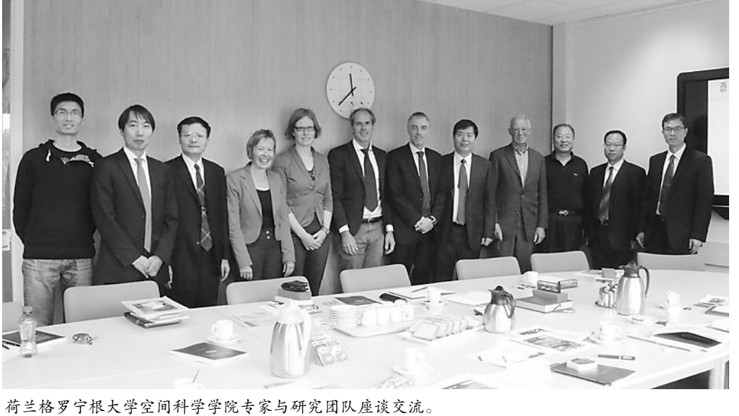
荷兰格罗宁根大学空间科学学院专家与研究团队座谈交流。

第四,项目执行期间,获得省部级教学成果奖3项,获批陕西省省级教学团队1支,农林经济管理专业入选第一批卓越农林人才教育培养计划改革试点项目;引进国内外优秀人才6人,培育教育部“新世纪优秀人才支持计划”入选者1人,获批陕西省“三秦人才津贴”