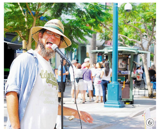
7 做自己喜欢的事儿 摄于美国洛杉矶 Santa Monica 市第三街。三街的艺人非常敬业,每人在什么时间出现在哪一地段都基本固定,好像上班一样。这位仁兄的鼓艺大致在上午的 11 点前后,每天一个人摆上这么一大摊子也不容易。有时候在公交车上也会看到他,挎着个包,文质彬彬的,不容易让人联想到他忘情的鼓声,还时不时来点抛抛槌的“花活”。