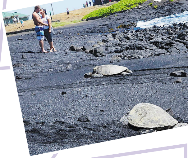
1 笑口常开 摄于洛杉矶市。一架小飞机在洛杉矶的天空上喷出一个笑脸,从苍穹上笑着众生,换来人们在地面上笑脸以对。