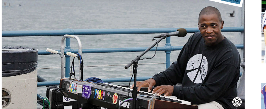
芝加哥,终点就在这座位于 Santa Monica 海滩上的栈桥。这条公路横贯美国东西,全长约 3939 公里,曾经是美国人在上世纪 30 年代沙尘暴肆虐期间西迁的主要通道,现如今已经成为承载美国历史文化的标志之一。栈桥上卖艺的黑人兄弟在海风中唱情歌,歌声醇厚,眼神销魂。