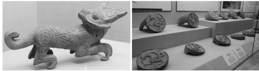
秦与戎——秦文化与西戎文化十年考古成果展现场