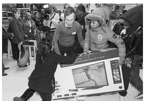
英国“黑色星期五”购物节购物者被打折促销吸引抢购物品。

相比之下,今年的“黑色星期五”在发源地美国却稍显安静。多数大型零售商在周四晚上就开门营业并把促销时间延长,一部分购物者被分流。同时,不少弗格森示威者到商场抗议示威,导致客流减少或商场关门。移动网络购物的增长也是美国“黑色星期五”不那么疯狂的原因之一。据估计,今年美国“黑色星期五”电商销售额比去年增长了20.6%,是美国电商历史上销售额最高的“黑色星期五”。 (张文静/编译)