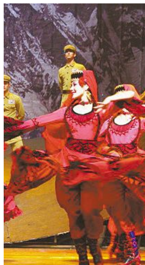
歌剧《冰山上的来客》剧照

为了突出这些意象，此次舞台设计上采用新材料制作的“冰山”在灯光和多媒体的配合下将闪现水晶般的光泽，挺拔的白杨树旁是边防战士的营房，多媒体投影的帕米尔红花像是燃烧的火焰，还有热闹喜庆的塔吉克族婚礼、巴洛托节叼羊比赛等民族色彩丰富的场景，让观众回到那个质朴的年代，回到那片风光无限的帕米尔高原。