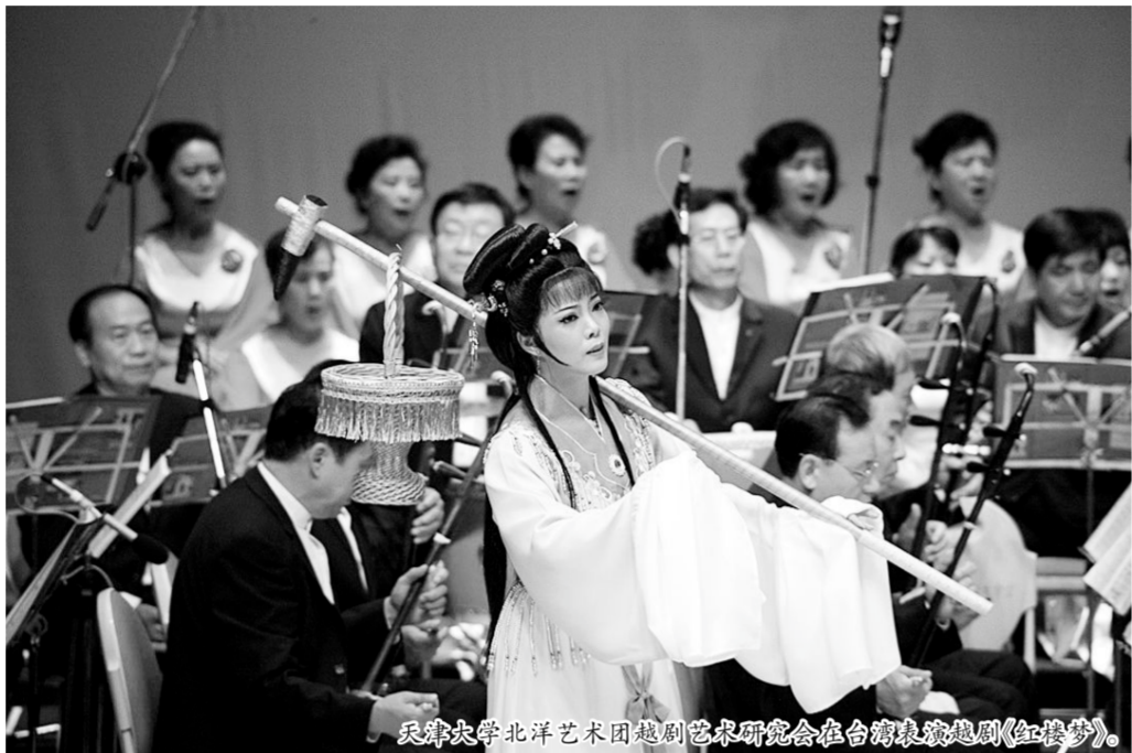
天津大学北洋艺术团越剧艺术研究会在校内演出越剧《红楼梦》。

蔡义汉是一个地道道的天津人。从上世纪50年代起,他在这座校园已经度过了半个多世纪的时光。作为我国最早对新能源进行研究的学者之一,蔡义汉曾跟随李四光重点研究地热,也曾与著名科学家钱学森有过接触,而蔡义汉要成立越剧团的最初想法,就是来自于钱学森的一番话。“钱老曾经说过,一个有科学创新能力的人不但要有科学知识,还要有文化艺术修养,没有这些是不行的。艺术上的修养不仅加深了我对艺术作品诗情画意和人生哲理的理解,也让我学会了艺术上大跨度的宏观形象思维。我觉得这番话非常有道理。”在接受《中国科学报》记者采访时,蔡义汉这样说。蔡义汉是浙江人,而浙江正是越剧的发源地,从小他便受到越剧文化的熏陶。对于这种被誉为“中国歌剧”的戏曲他甚是喜爱。在退休之后,虽然各种事物依然繁忙,但面对传统艺术在校园的缺失,以及学生们对传统文化的茫然,蔡义汉总觉得自己该做点什么。“其实我是做过调查的。”蔡义汉说,一次,他用了一下午的时间,坐了多趟天津某高校的