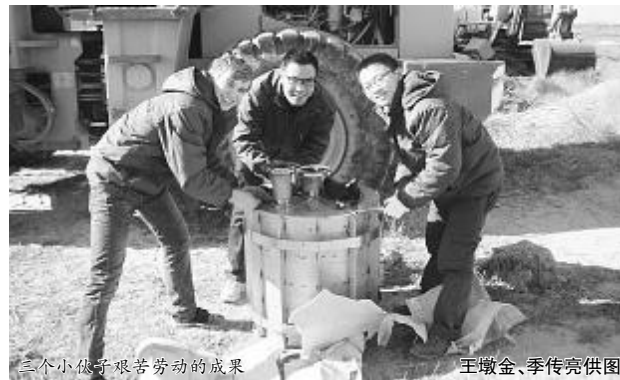
三个小伙子艰苦劳动的成果