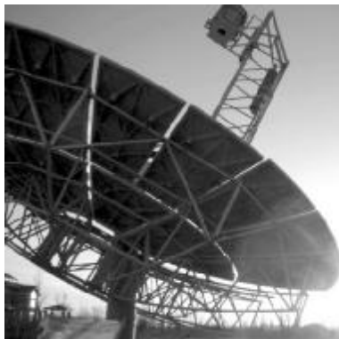
太阳能空气吸热器