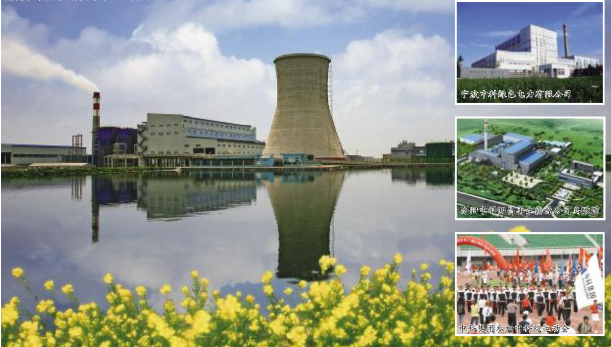
慈溪中科慈溪环保热电有限公司全景图

在运营过程中,项目设备出现了锅炉运行周期短、烟气处理设备阻力较大和掺煤量偏高等问题。中科集团经过充分调研、反复论证,于2011年对宁波中科和慈溪中科的两项循环流化床垃圾焚烧炉进行技改。此次技改全面达到预期效果,实现纯烧原生垃圾连续运行50天,在焚烧垃圾状态下掺烧80%含水污泥,不加碱中和烟气环保达标三大突破。技改的成功成为中科集团环保事业发展史上的重大里程碑,为环保产业快速健康发展壮大奠定坚实基础。