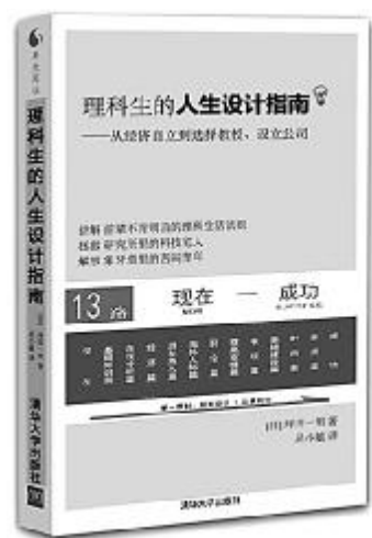
《理科生的人生设计指南》, [日]坪田一男著,陈涛译,清华大学2013年5月出版

本书文章精选自《朱光潜全集》中的经典作品。于本书中畅游,可以寻味一代大师笔调对人生情趣的诠释,体悟睿智而优雅的人生态度,于忙碌中追寻内心的旷达,创造美的人生。