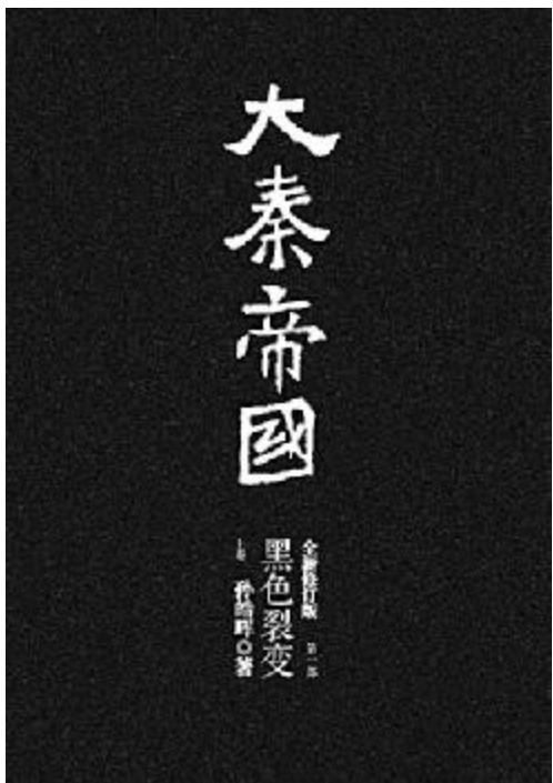
网站的网友将全书的知识性段落汇总分类编辑,整理出14大类120余万字。

这500余万字,不仅展现了宏大的历史事件,还是一部“大秦帝国百科全书”。《大秦帝国》