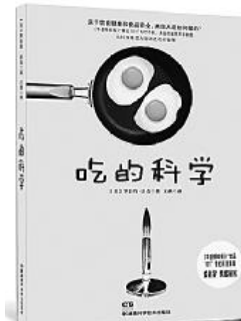
《吃的科学》, [美]罗伯特·沃克著,王燕译,湖南科学技术出版社2013年7月出版

作者认为,要想做高质量的研究工作不只是一喜欢研究就行,还必须考虑到很多现实问题。经济问题、留学问题、论文等业绩的积累方法问题、为人处世问题等等。书中作者用自己的亲身经历做例子,指出要想顺利地进行自己喜欢的工作,必须学会如何建立人际关系,学会如何在竞争中表现自己,如何获得经济上的安定。