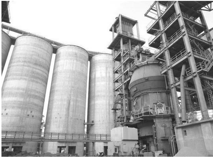
作为钢铁行业里最赚钱的民企之一,日钢对于“被兼并”的命运颇有些“心不甘情不愿”。图为日钢厂区。