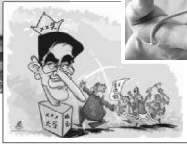
▲“人耳鼠”争议 ▲首次撤销国家科技奖项