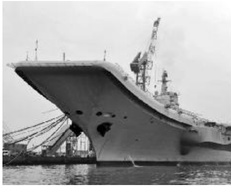
▲中国改建的瓦良格号航母