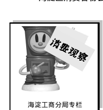
海淀工商分局专栏

海淀消协在此特别提醒消费者:在进行团购交易前,到工信部网站的“公共查询”模块,输入网站的域名(网站网址中去掉www部分),审查网站ICP资质,如果主办方为个人,消费者的权益将难以保障,建议不与其进行交易。对于团购网站,应该有许可证号,北京区域的格式是“京ICP证号”而不是“京ICP备案号”。