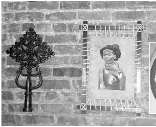
◀ Meskerem 餐馆墙上的女子画像,是埃塞俄比亚历史上有名的示巴女王。