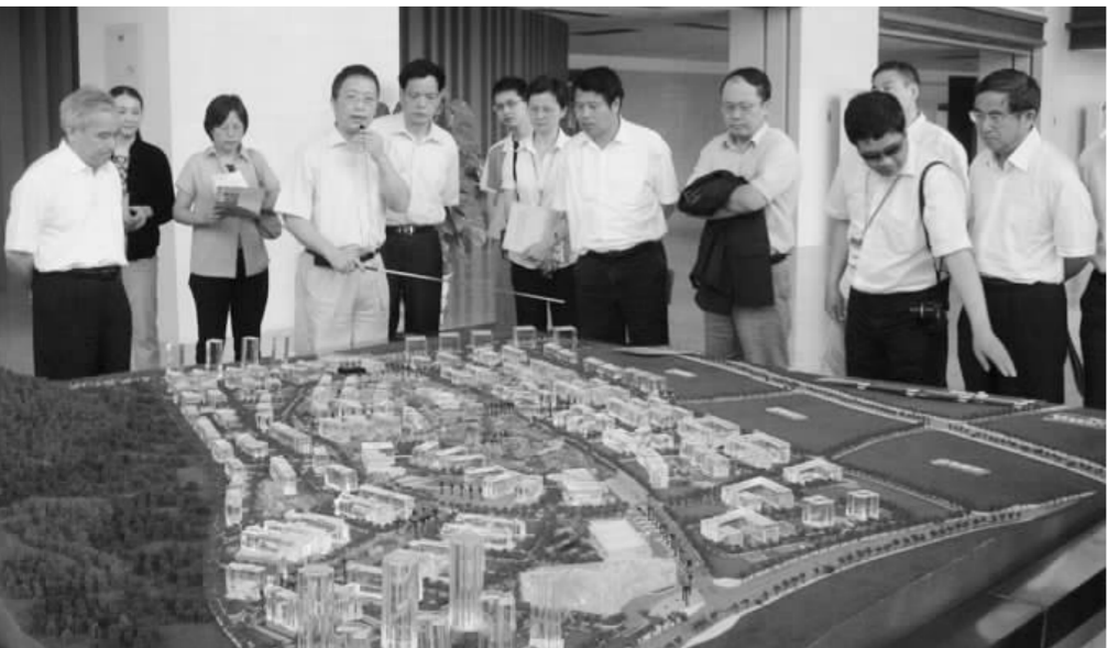
调研组在厦门软件园了解高新技术发展情况。