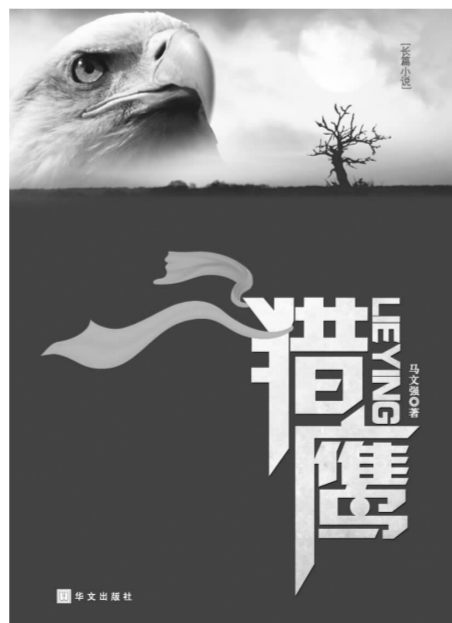
《猎鹰》,马文强著,华文出版社2010年1月出版,定价28.00元

在中国大地上,到底还有多少看不见的黑恶势力?到底还有多少让人们有怒不敢言的苦难?打黑——其实也要反过来打打白。