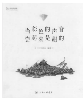
《当彩色的声音尝起来是甜的》,科学松鼠会编著,上海三联书店2009年1月出版,定价:25.00元

对于《催情药》、《月经休假》、《屁股的哲学》一个个难登大雅之堂的“科学八卦”,书中却带给了大家它们背后妙趣横生的科学知识;《吸毒的老鼠》、《懂