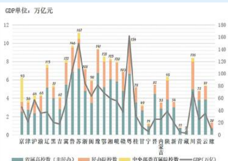
图4.各地高校数量与GDP产值高度吻合

一个很有意思的现象是,各地高校数量往往与其GDP总量排名明显正相关,这也意味着更多的经济总量呼唤更多的大学。