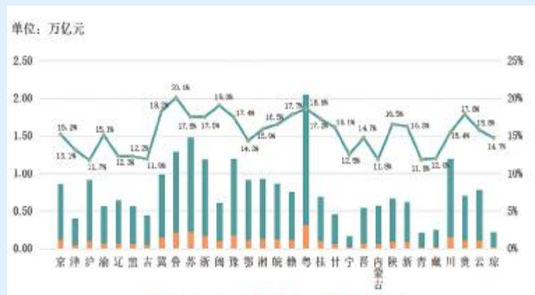
图3.各地一般公共预算教育经费及其一般公共预算支出占比

2019年,全国的一般公共预算教育经费达3.46万亿元,占一般公共预算支出的17%。而全国仅10地占比高于或等同于此,其中山东居于榜首占比20%,福建为19%,广东为18.6%,这意味着当地政府更愿意在财政支出上给予更多的教育投入。