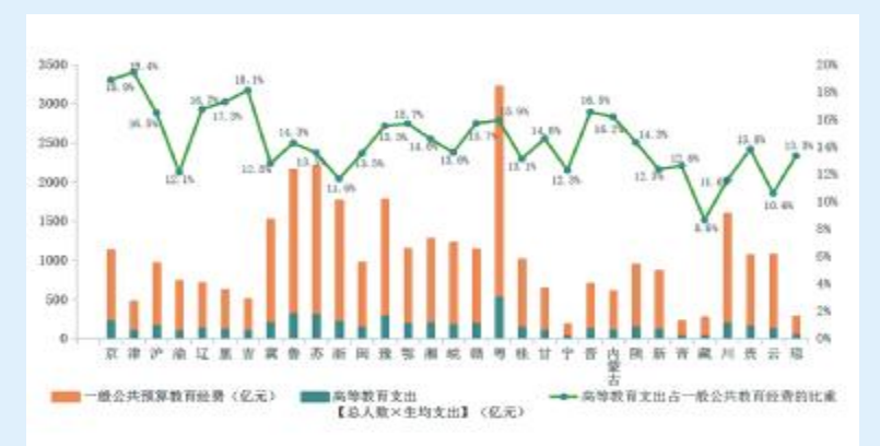
图6.各地高等教育支出占一般公共预算教育经费比重

超过该值。其中天津占比最高达到19.4%,北京也有18.9%,而西藏最低仅有8.6%。