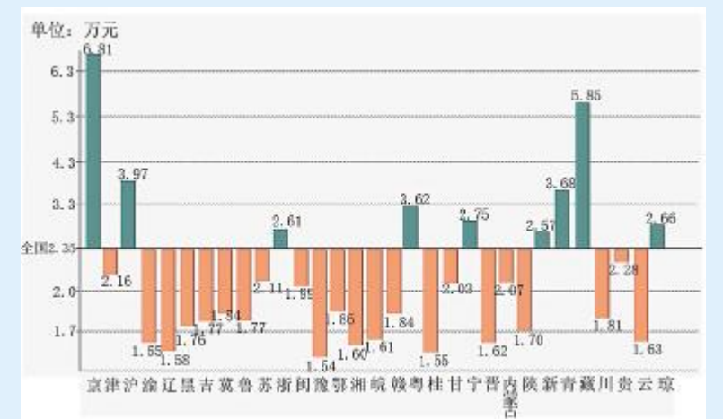
图7.各地2019年普通高校生均一般公共预算教育经费

公立大学现行办学成本机制下,政府要实现稳定和持续增长的财政性教育投入仍然任重道远。同时,高校不断加强社会服务、不断开源也是努力方向。