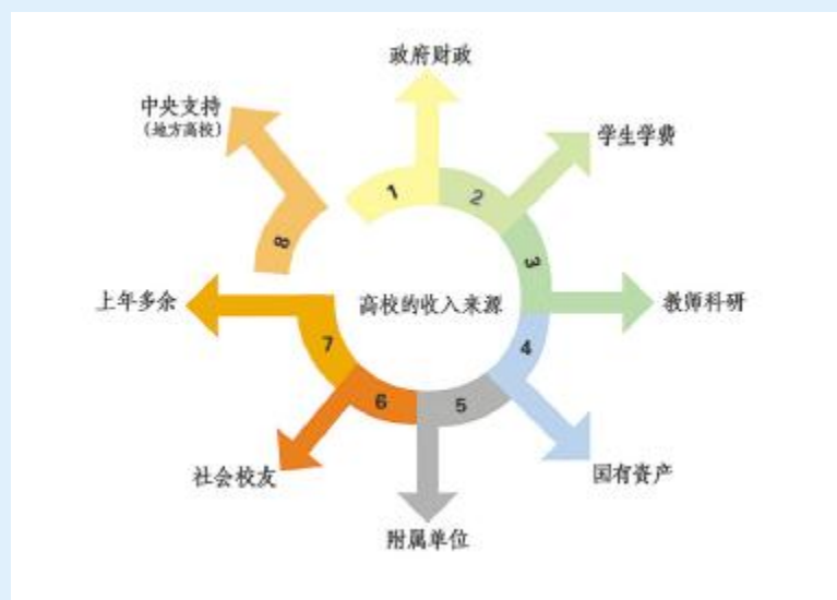
图1.我国公办高校办学收入的几大来源

由于不同高校社会捐赠和社会服务收入水平差异大且稳定性不够,所以衡量公办大学的收入主要看财政拨款和事业收入,而财政拨款已基本固定为生均拨款(其中本、专科和研究生有所差异)。显然,衡量各地对高等教育是否重视往往看其财政性教育经费和生均拨款。