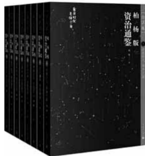
《柏杨版资治通鉴》共8册,柏杨著,人民文学出版社2019年12月出版

3月7日是台湾著名作家柏杨诞辰100周年纪念日。柏杨原名郭定生,生于河南开封,之后去往台湾。他一生两次入狱,但著作不辍,平生有十年小说、十年杂文、十年牢狱、五年专栏、十年通鉴等历程,曾在狱中完成《中国人史纲》。他在上世纪末出版的《丑陋的中国人》引起了极大的争议。而《柏杨版资治通鉴》被誉为最有价值和最畅销的一部书。