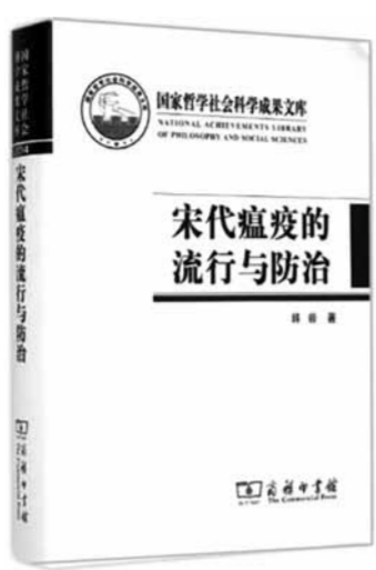
《宋代瘟疫的流行与防治》,韩毅著,商务印书馆2015年4月出版

总之,瘟疫流行给宋代社会带来极大的威胁和挑战,不仅造成人口死亡,社会经济惨遭破坏以及灾民流动,也引起了人们对疫病流行的恐惧。官吏死亡和缺官现象引起的地方统治秩序混乱,促使中央政府和各级官吏积极地认识疫病,寻找防疫之法。“自古以来,