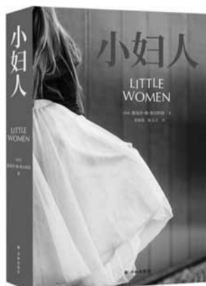
《小妇人》,美国路易莎·梅·奥尔科特著,刘春英、陈玉立译,译林出版社2020年2月出版

“我一直抱着把《资治通鉴》译成现代语文的心愿,而今得以实现,非常兴奋。”20世纪80年代,柏杨用独特的语言,将全书翻译为白话文,使原为晦涩难解的文字,有了平易近人的一面。此次出版,出版社按照国家地图出版标准,在原有历史地图基础上,重新补绘了今天的中国疆域边界,使历史地图表达更规范和准确。