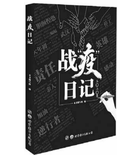
《战“疫”日记》即将由世界图书出版公司出版