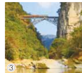
①汉阳铁厂1905年购置的8000马力蒸汽机现状 ②洛阳拖拉机厂履带拖拉机装配下线 ③滇越铁路人字桥现状